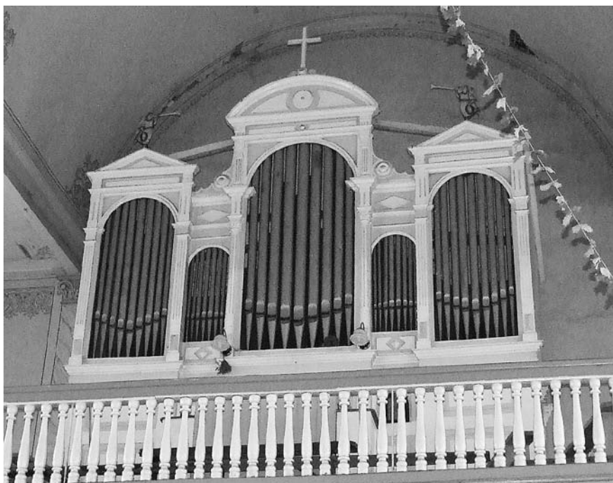
VIEKŠNIŲ BAŽNYČIOS VARGONAI

pastatė Karsakiškio (~1905), Pakalnių (~1910) bei Kazliškio (1913) bažnyčiose 63 . Šis meistras vargonuose naudojo pneumatinę traktūrą ir kėgelines oro skirstymo dėžes.