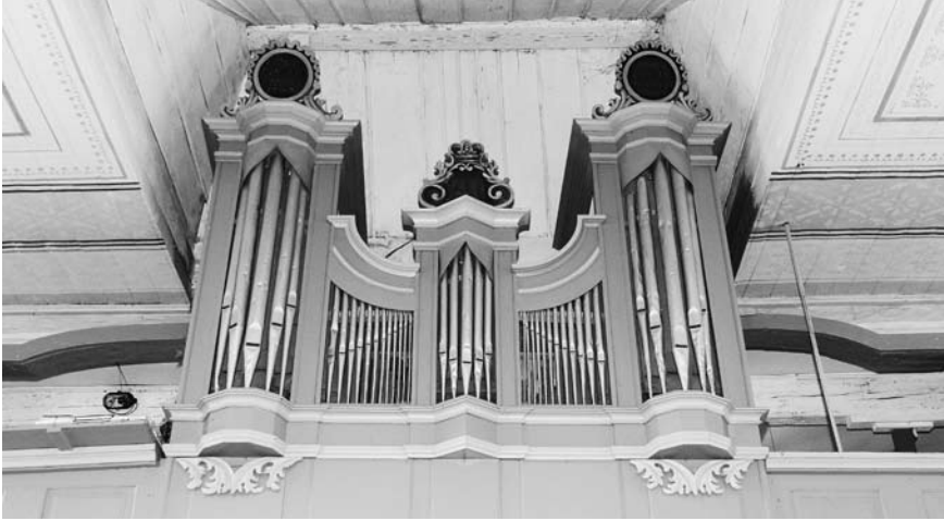
EIGIRDŽIŲ BAŽNYČIOS VARGONAI.

1821 m. jo statyti vargonai Varnių katedroje 39 (1 manualas, 16 registru). Yra žinoma, kad maždaug tuo metu (1826) Varniuose būta mechaniko, dirbusio fortepijonus ir vargonus 40 .