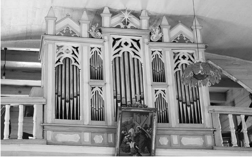
RUDIŠKIŲ BAŽNYČIOS VARGONAI.

macija apie meistrą įrašyta vargonų dumplių viduje. Tai nedidelis pozityvas, kurį sudaro 1 manualas ir 4 registrai. Tokio tipo instrumentus šis meistras paprastai dirbino Latvijos mokykloms. Kaip minėta, nedidelių pozityvų C. P. O. Herrmannas buvo sukūręs per 50, tačiau Lietuvoje tai vienintelis žinomas išlikęs pavyzdys. Kalnelyje esantis instrumentas yra saloninis, kartotinio tipo, galima sakyti – tiražuotas, tačiau sumeistruotas itin profesionaliai, iš kokybiškų medžiagų. Vis dėlto šių vargonėlių statyboje panaudota ir pigesnių to meto naujovių – pavyzdžiui, dalis vamzdžių pagaminti iš cinko, o ne brangesnės alavo-švino skardos. Šių vargonų kartotinį tipą liudija nepriekaištingi mechanikos ir vamzdyno darbai, juodmedžio ir kaulo klaviatūra. Instrumento traktūra – mechaninė, oro skirstymo dėžė – sklendinė, dumplės – vienos, lygiagrečių klosčių, dumiamos mechaniškai koja.