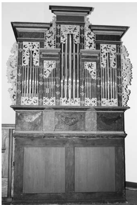
KRETINGOS VIEŠPATIES APREIŠKIMO ŠVČ. MERGELEI MARIJAI BAŽNYČIOS KOPLYČIOS VARGONAI.

Žymiai mažesniais, tačiau unikaliais 1680 m. nežinomo meistro sukurtais vargonais – pozityvu – Kretingos bernardinų (dab. pranciškonų) bažnyčia gali didžiuotis ir šiandien. Bažnyčios koplyčioje 2004 m. buvo restauruoti iš Gintališkės bažnyčios perkelti vargonai. Tai – labiau saloninio, o ne bažnytinio tipo instrumentas, į Gintališkės bažnyčią veikiausiai perkeltas iš kokio nors netolimo dvaro. Šiandien šie ne tik