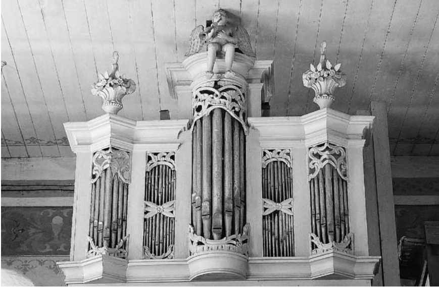
PAŠUVIO BAŽNYČIOS VARGONAI.

vargonų remonto 30 , o 1767 m. už 190 muštinių talerių padarė 10 balsų 31 vargonus Alsėdžių bažnyčiai 32 (nė vieni neišliko).