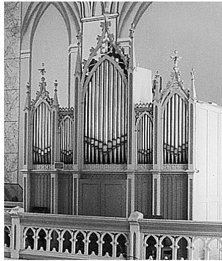
BIRŽŲ BAŽNYČIOS VARGONAI.

Weissenborno instrumentai turi panašumo su Lietuvos vargondir-