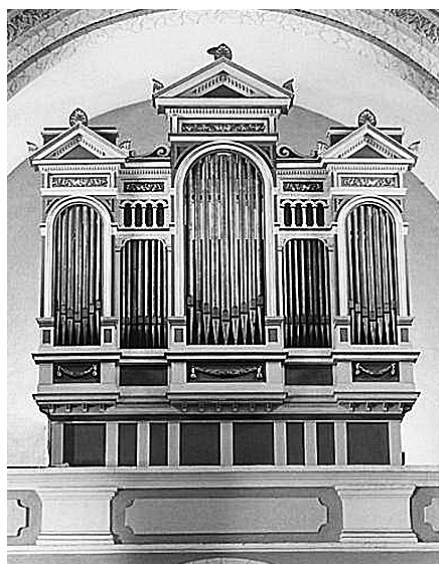
ŽEMAIČIŲ KALVARIJOS BAZILIKOS VARGONAI.