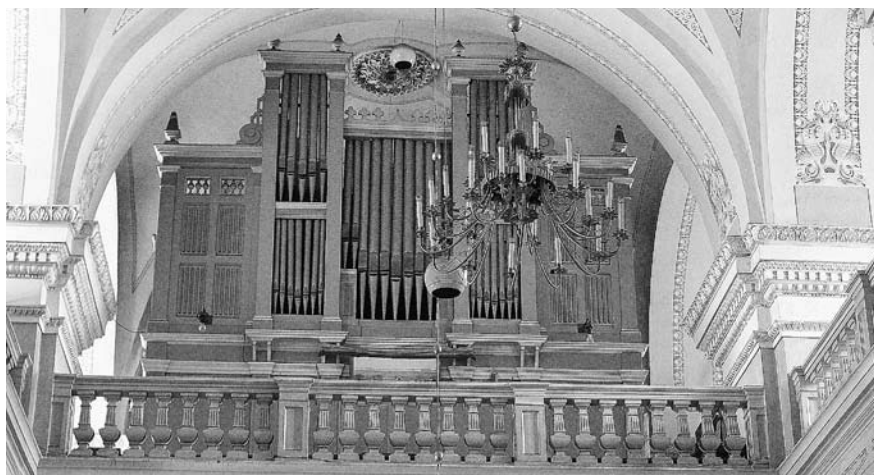
JONIŠKIO BAŽNYČIOS VARGONAI. Girėno Povilionio nuotr.

bažnyčioms būdingesne dispozicija – tai 16 pėdų registro naudojimas manuale 58 . Kitas dažnas C. P. O. Herrmanno vargonų bruožas – tai specifinių įrenginių (akustinio būgno, kartais ir varpelių, kurie buvo būdingesni barokiniams instrumentams), įmontavimas. C. A. Herrmannas, galima sakyti, tęsė tėvo tradicijas, pavyzdžiui, ilgai naudojo seno tipo pleištinės dummies. Jo (kaip ir tėvo) instrumentams būdinga klasikinių vargonų dispozicija, gana skardaus, kieto garso intonavimas.