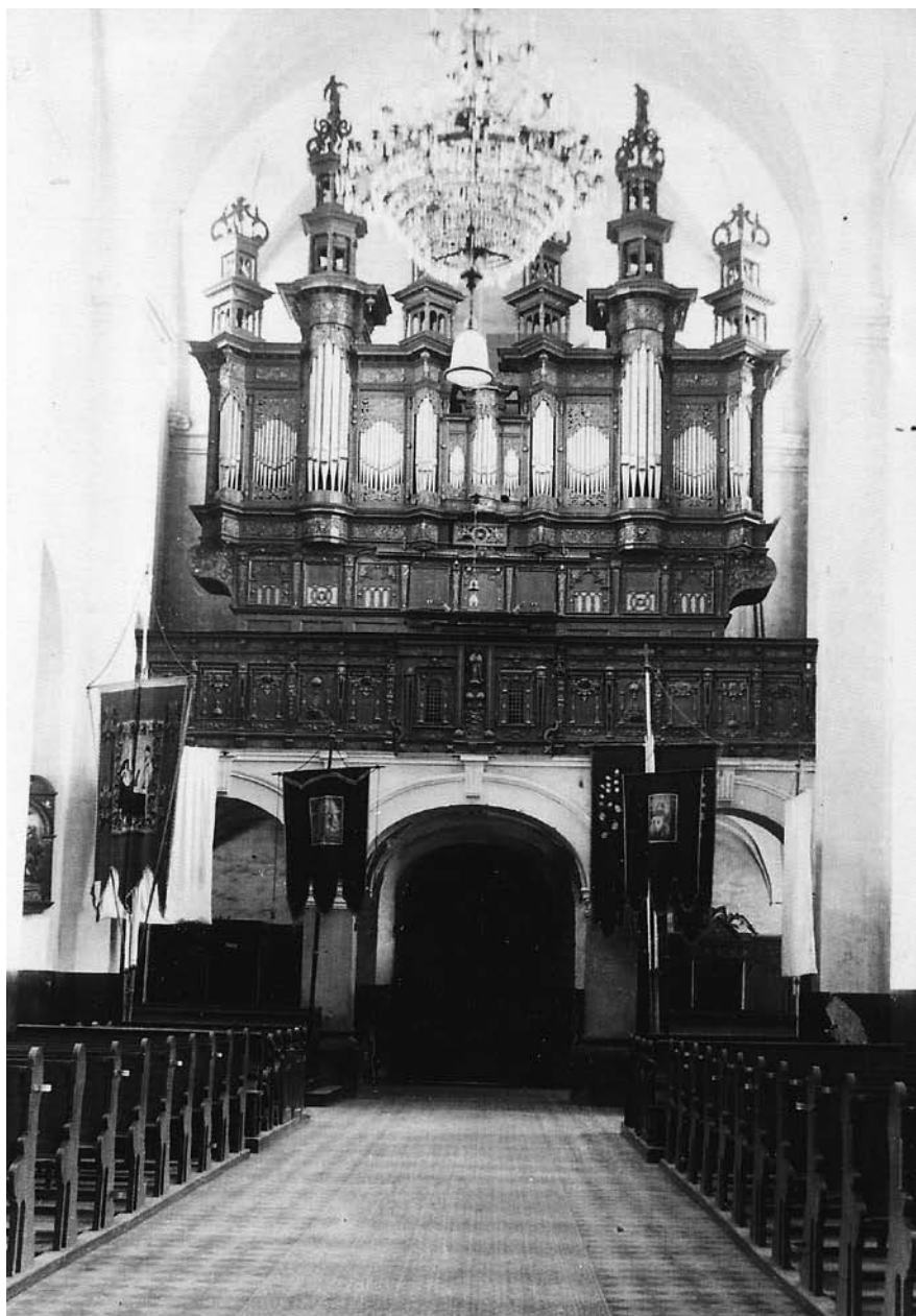
KRETINGOS VIEŠPATIES APREIŠKIMO ŠVČ. MERGELEI MARIJAI BAŽNYČIOS VARGONAI IKI 1940 M.