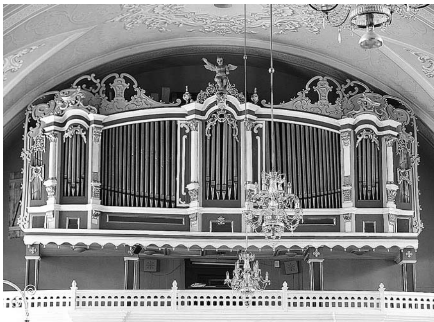
TELŠIŲ KATEDROS VARGONAI.