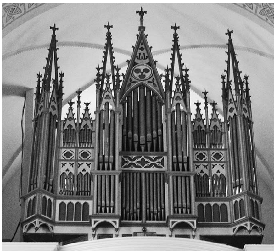
SKIRSNEMUNĖS BAŽNYČIOS VARGONAI.

yra įgilinta vieta odiniams registrų pavadinimų įdėklams. Beveik identiška Bebrenės vargonams ir Žagarės instrumento traktūra – griežykloje esančių medinių velenėlių forma ir dirbinimo būdas. Taigi gali būti, kad Žagarėje stovi Radavičiaus instrumentas, nes vargonai datuojami apie 1865 m. 71 Beje, yra žinoma, kad tais pačiais metais Radavičius naujus vargonus pastatė Subatės (Latvija) katalikų bažnyčioje.