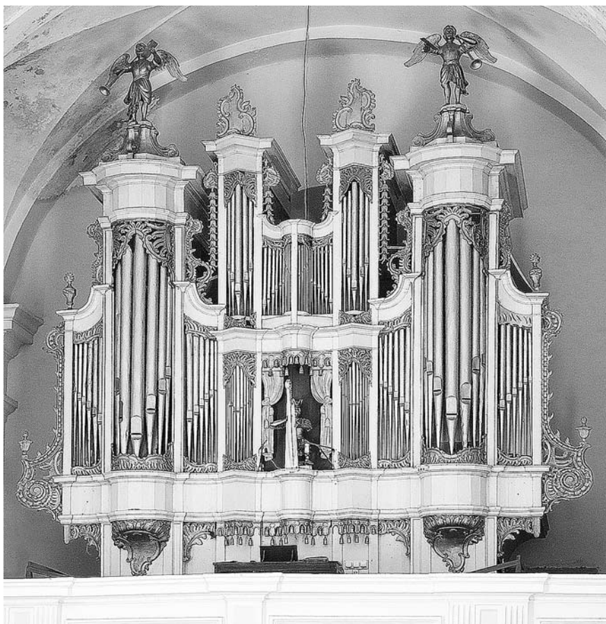
KURTUVĖNŲ BAŽNYČIOS VARGONAI.