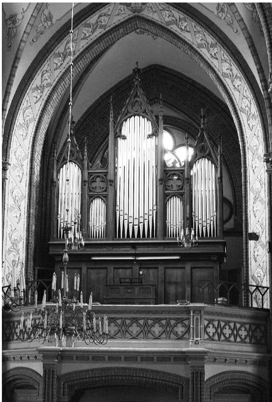
ŠVĖKŠNOS BAŽNYČIOS VARGONAI.