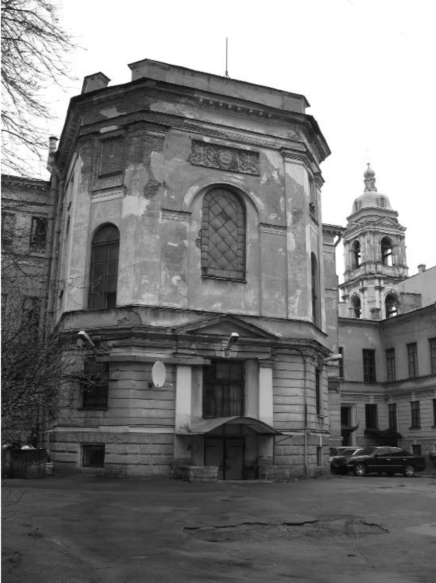
Akademijos bažnyčia, vaizdas iš pirmojo akademijos kiemo. 2008