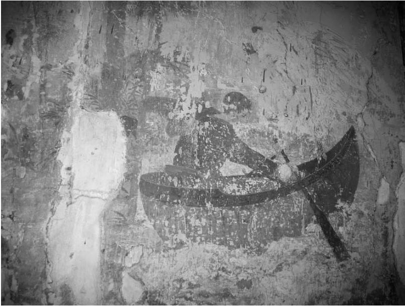
Akademijos bažnyčios sienų tapybos fragmentas. XIX a. pabaiga – XX a. pradžia (atidengtas XX a. aštuntame dešimtmetyje). Vilmos Žaltauskaitės nuotr. 2008