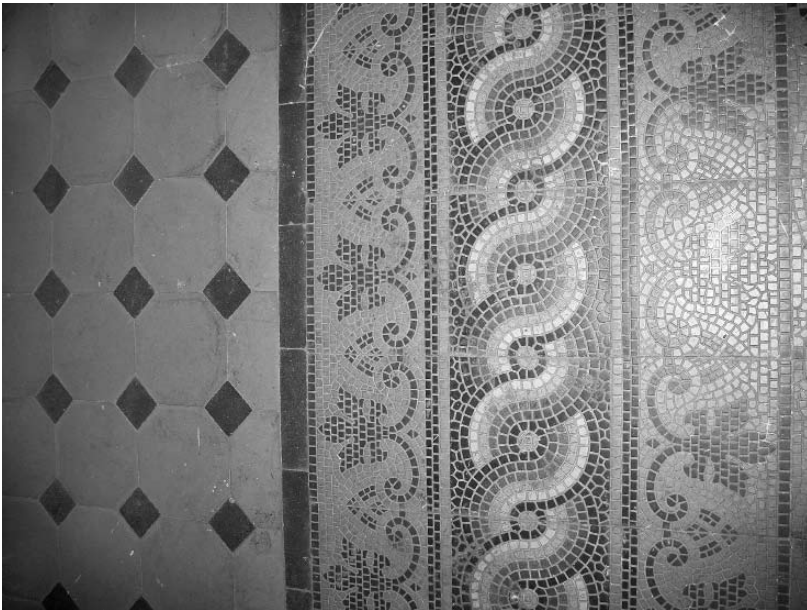
Akademijos bažnyčios mozaikinių grindų fragmentas. 2008