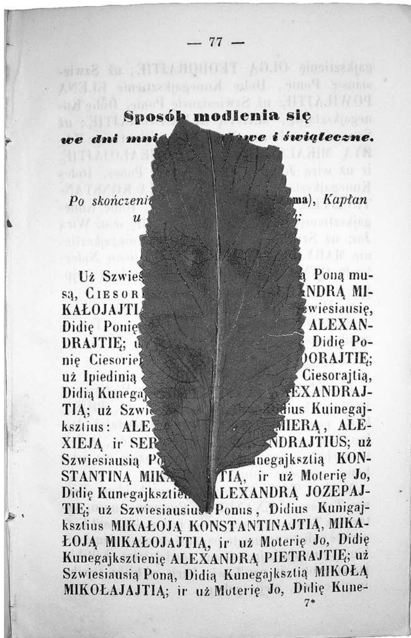
2. Vaistinės balzamitos (lot. Balsamita major Desf.) lapas iš Directorium horarum canonicarum et missarum pro dioecesi Telsensi seu Samogitensi in annum domini 1859 (Vilnius, 1858, p. 77) (LNB, Humanitarinių mokslų dokumentų fondas, LAK4193)