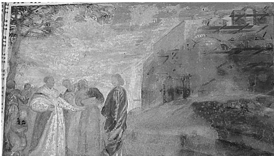
„Virš Šv. Brunono palaikų statoma bažnyčia“, freska, tarp 1678–1685, M. Palloni