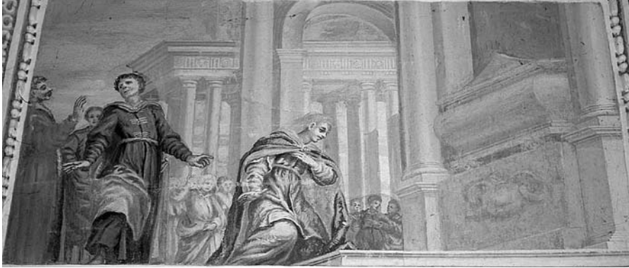
„Stebuklas prie Šv. Brunono palaikų“, freska, tarp 1678–1685, M. Palloni