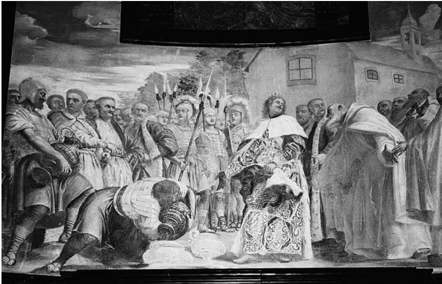
„Karalius Boleslovas Narsusis aplanko pirmuosius Šv. Romualdo mokinius Lenkijoje“, freska, tarp 1678–1685, M. Palloni