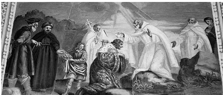
„Šv. Brunonas krikštija pagonių karalių“, freska, tarp 1678–1685, M. Palloni