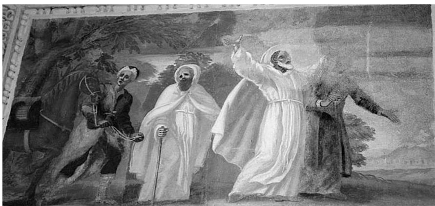
„Šv. Brunonas išvyksta į misijas“, freska, tarp 1678–1685, M. Palloni