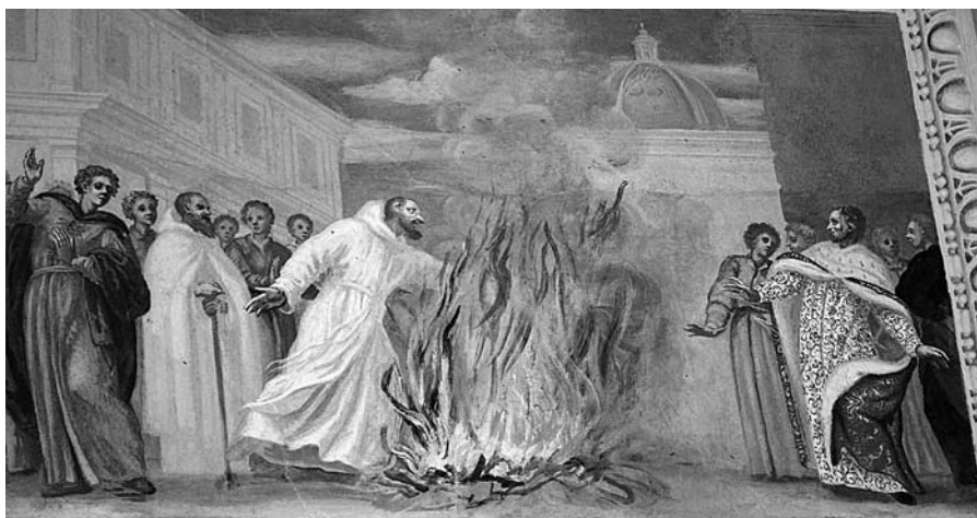
„Šv. Brunono išbandymas ugnimi“, freska, tarp 1678–1685, M. Palloni