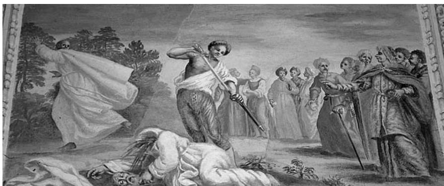
„Šv. Brunono nukirsdinimas“, freska, tarp 1678–1685, M. Palloni