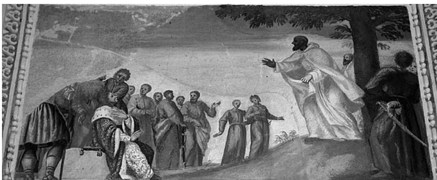
„Šv. Brunonas pamokslauja pagonių karaliui“, freska, tarp 1678–1685, M. Palloni