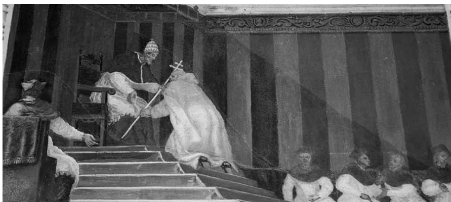
„Popiežius Silvestras II įšventina Šv. Brunoną arkivyskupu“, freska, tarp 1678–1685, M. Palloni